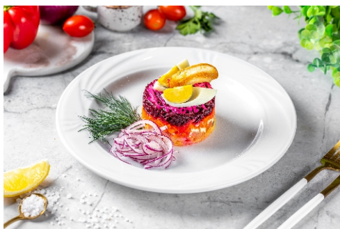
Салат «Семга под шубой»