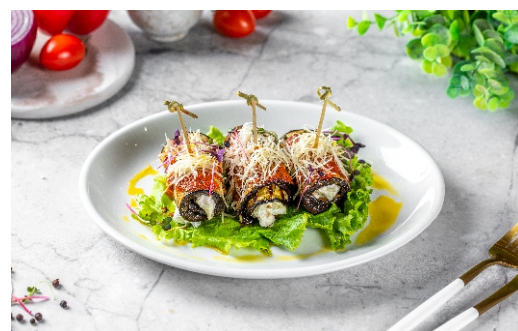
Баклажаны с каймаком