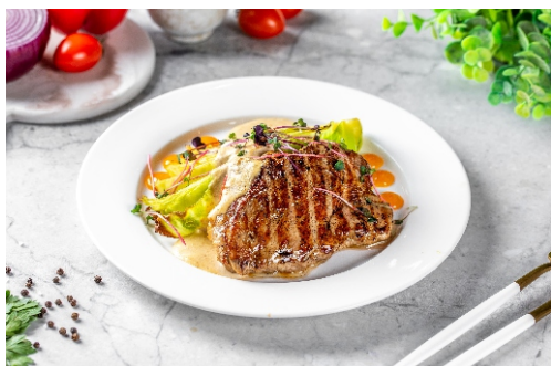
Стейк из свиной шеи