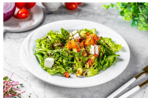
Салат теплый с курицей