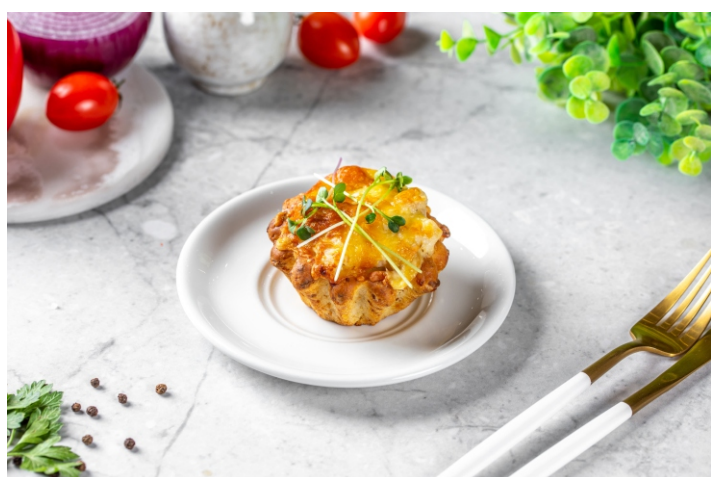
Жульен из курицы в лепешке