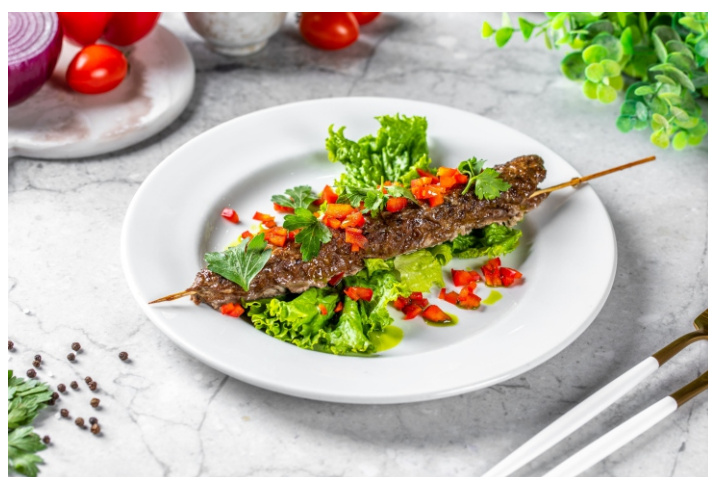
Люля-кебаб из оленины