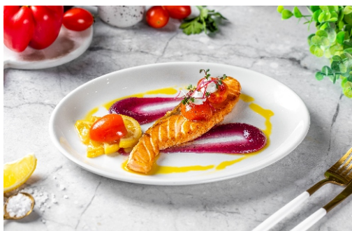
Стейк из семги с соусом Блю